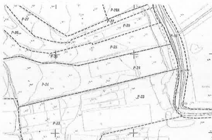
Figura 1: Deslnde presentado para solicitud de informe,

Es copia auténtica de documento electrónico